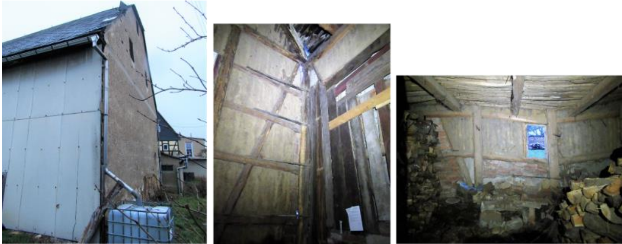
Die zu sichernden Schäden an der Kulturscheune

Momentan arbeiten wir auch an der Bausicherung des Schwalbenhauses. Dieses denkmalgeschützte Gebäude aus dem 18. Jahrhundert werden wir in den nächsten Monaten ebenfalls denkmalgetreu und möglichst nachhaltig und ökologisch restaurieren und wieder nutzbar machen. Damit schaffen wir weiteren notwendigen Platz für die administrative und kreative Vereinsarbeit, für die Umsetzung von Bildungs- und Seminarveranstaltungen sowie für die Unterbringung von Gästen, größeren Gruppen und weiteren Bewohner*innen. Dabei ist es uns wichtig, ökologisch nachhaltig zu bauen und möglichst energieeffizient zu leben. Alex unterstützt uns tatkräftig im Rahmen seines Bundesfreiwilligendienstes bei diesem Vorhaben.