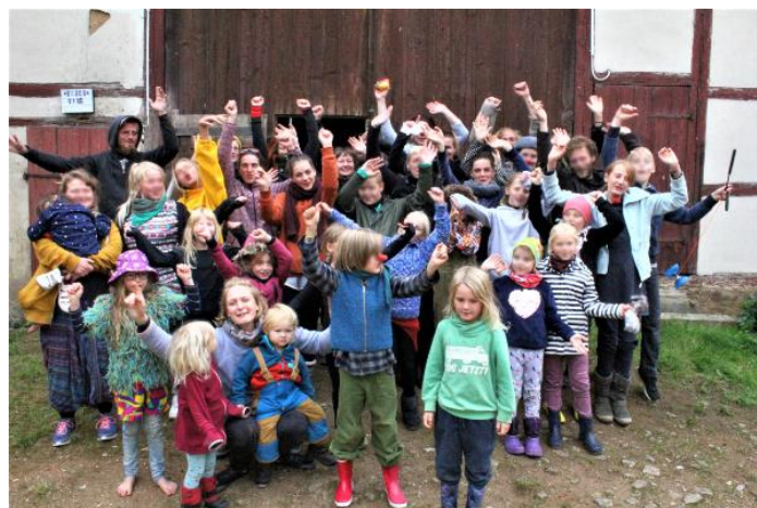
Familienzirkus September 2022