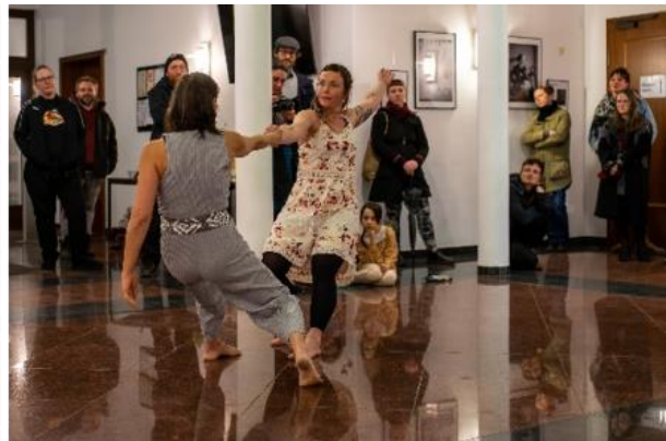
Künstler*innen des Mondstaubtheaters mit ihrer Performance zur Eröffnungsveranstaltung im Rathaus

Auch die weiteren Angebote im Verlauf der Veranstaltungsreihe, bestehend aus einem Siebdruck-Workshop im Jugendladen, einer generationsübergreifenden Lesung in der Bibliothek sowie dem Figurentheater zur Kritik am patriarchalen System, wurde interessiert aufgenommen.