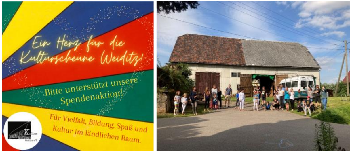
Logo unserer Spendenkampagne und die zu restaurierende Scheune

Bereits in unserem 1. Newsletter haben wir die geplante Spendenkampagne unseres Vereins angekündigt. Im Fokus steht unsere Kulturscheune, deren Bausubstanz dringend wichtiger Instandhaltungsmaßnahmen bedarf. Sie dient uns u.a. als Ort für unsere Zirkusarbeit und ist damit Grundlage für die Realisierung unserer gesamten soziokulturellen Arbeit im ländlichen Raum. Die Vorbereitung zu dieser Kampagne laufen derzeit auf Hochtouren. Ab dem 1. April 2023 findet Ihr unter: https://support.kulturscheune-weiditz.de/ oder dem folgenden QR-Code eine Landingpage, auf der Ihr alle Informationen zum Ziel der Spendenkampagne, den möglichen Spendenwegen sowie zur Verwendung der Spendeneinnahmen finden werdet.