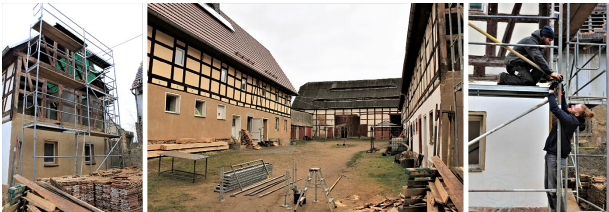
Arbeiten am Schwalbenhaus

Momentan arbeiten wir auch an der Bausicherung des Schwalbenhauses. Dieses denkmalgeschützte Gebäude aus dem 18. Jahrhundert werden wir in den nächsten Monaten ebenfalls denkmalgetreu und möglichst nachhaltig und ökologisch restaurieren und wieder nutzbar machen. Damit schaffen wir weiteren notwendigen Platz für die administrative und kreative Vereinsarbeit, für die Umsetzung von Bildungs- und Seminarveranstaltungen sowie für die Unterbringung von Gästen, größeren Gruppen und weiteren Bewohner*innen. Dabei ist es uns wichtig, ökologisch nachhaltig zu bauen und möglichst energieeffizient zu leben. Alex unterstützt uns tatkräftig im Rahmen seines Bundesfreiwilligendienstes bei diesem Vorhaben.