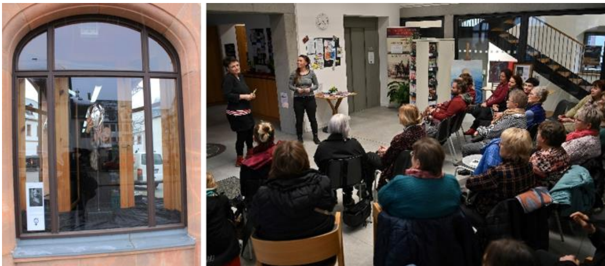
Begrüßung der Interessierten und Teilnehmenden in der Rochlitzer Bibliothek

Zum Auftakt der Veranstaltungsreihe fanden sich am 8. März ca. 35 Besucher*innen zwischen 9 und 85 Jahren in der Rochlitzer Bibliothek ein, um anschließend den geführten Rundgang zum Rathaus zu begehen.