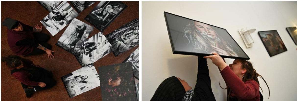
Bei der Vorbereitung der Ausstellung der verschiedenen Kunstobjekte

Als besonderes Anliegen galt die Solidarisierung mit den Protesten im Iran. Die Initiative des Kulturscheune Weiditz und Artenreich e.V. wurde durch den Seniorenrat und Jugendladen sowie die Bibliothek und das Rathaus der Stadt Rochlitz unterstützt. Das breit gefächerte Programm aus Kunst- und Kulturangeboten sowie einem Konzertabend zum Abschluss der Veranstaltungsreihe, sollte ein diverses Publikum ansprechen. Wir freuen uns, dass wir mit solch einer Veranstaltung dazu anregen konnten, sich mit dem „Weiblichen“ und seinen Facetten und Problemlagen auseinanderzusetzen. Wir hoffen, dazu beizutragen, die Perspektiven und Erfahrungen sich als weiblich verstehende Menschen stärker in die öffentliche Auseinandersetzung zu integrieren und damit auch die ungerechten Geschlechterverhältnisse abzubauen.