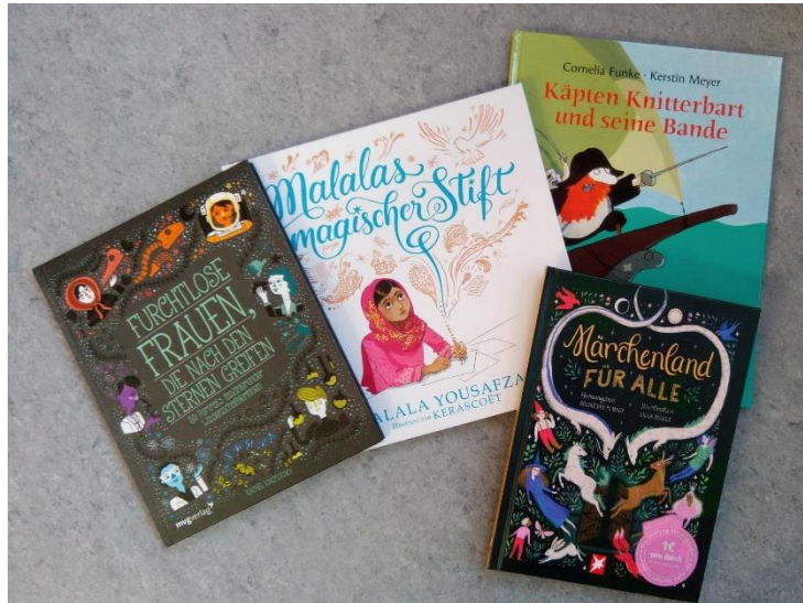
Bücher aus der Kinderlesung "starke Mädchen" in der Bibliothek Rochlitz