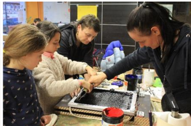
Feministisches Figurentheater zur Kritik am Patriarchat in der Bibliothek Rochlitz und Siebdruck im Jugendladen Rochlitz